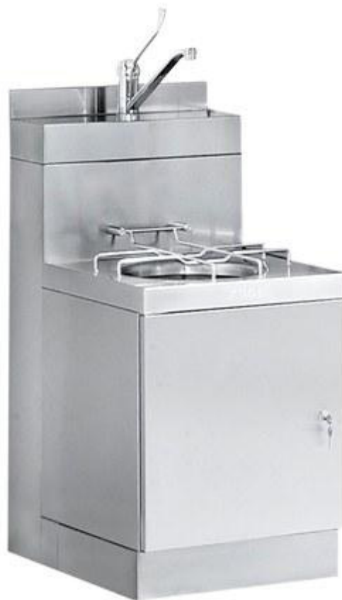
1. ενδεικτική εικόνα νιπτήρα

Με τη προσφορά θα υποβληθεί και το ακριβές αναλυτικό σχέδιο από το οποίο θα προκύπτουν τα τεχνικά χαρακτηριστικά του νιπτήρα.